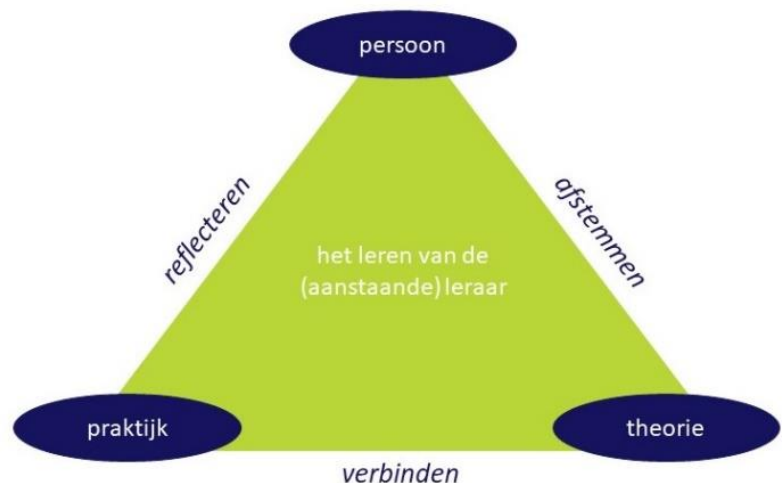
Figuur 2: leerproces van (aanstaande) leraren

We vinden het van belang dat studenten maar ook de betrokken collega's een relatie leggen tussen praktijk, persoon en theorie door te reflecteren, verbinden en af te stemmen. Het opleidingsteam probeert dit cyclische proces constant bij de studenten te stimuleren en er zelf ook blijf van te geven. Bij schoolbijeenkomsten en verdiepingsmiddagen is de afspraak waar mogelijk steeds theorie cq bronnen te koppelen aan ingebrachte thema's; bij professionaliseringsbijeenkomsten wordt altijd de link gelegd met theorie cq bronnen; we streven ernaar bij elk kernteamoverleg te starten met het bespreken van een artikel of andere bron om ook zo de verbinding te maken tussen theorie-praktijk-persoon (en invulling te geven aan onze kernwaarde: pratise what you preach).